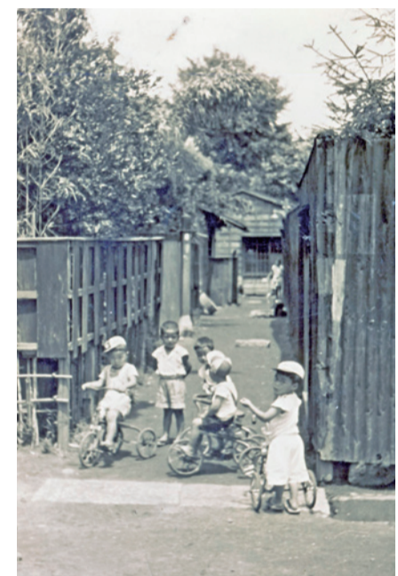
三輪車暴走族(昭和28年 南品川1丁目2番29号付近、御蔵山稲荷神社前の路地)

今も残る子どもから大人まで楽しむことの出来る言葉遊びに「しりとり」がある。あるとき、娘が言うに「ま」で終わって自分の番になると、つい、「まり」と答えてしまう。もしくは「まり」を思い浮かべる。でも娘には「まり」で遊んだ覚えがないという。なのに「しりとり」では答えてしまうのは何故だろう。私は今年69歳になるが、小学生低学年のころには女子が直径20cm位のゴムマリで、路地やお稲荷さん境内で遊んでいたことを覚えている。今はカラーボールと材質や大きさも変わった。いつ頃から「まり」を使って遊ぶことが無くなったのだろうか。どこかの児童センターなどで継承しているのだろうか。自分が生きてきた軌跡のなかで物事や環境の変化など、こんな疑問を考えていくのが、品川宿史談会だと思っている。さらに過去の歴史を発掘することも大事であるが、身近なこと故残らない今の品川を記録して将来に残していくことも必要と考えている。 2019年1月27日には「品川町による自力・海辺埋立とまちづくりー明治20年