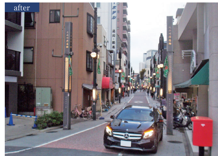
整備後、電線・舗装・街路灯