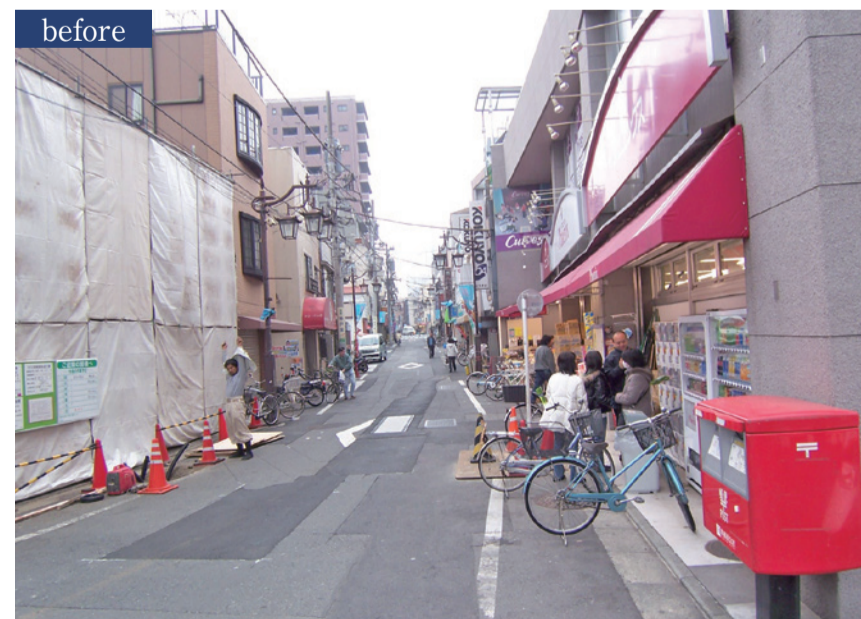
整備前の北品川2丁目

助金を受けて整備された。この補助制度は来年度以降も継続される予定です。制度の概要をご簡単に説明します。詳しいことは区の都市計画課に相談してください。 1.対象となる建物:旧東海道・北馬場通り・南馬場通り・ジュネーブ平和通り面に面している建物。 2.対象となる整備内容:外観や外構、看板や暖簾・灯籠など「旧東海道にふさわしい街なみづくりに貢献する」修景。