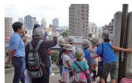
しながわっこプロジェクト

「しながわ」を愛する子供たち「しながわっこ」を増やそう!と始めたプロジェクト。城南第二小「まち歩き」、品川学園の自治会活動などジャンルを問わず、近隣の小中学校と連携し、企画を通じて活動しています。どの