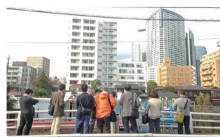
品川宿アカデミア構想

まちづくり協議会のパイプとしてきた現行の「東海道品川宿まちづくり計画書」。ここに書かれた多くの計画は高い確率で達成されています。そろそろ次世代の品川宿のために新しい計画書をつくらうと3年前に「新版まちづくり計画書づくり」が始まりました。まちづくりは継続的である。20年後、30年後のまちをイメージして、まちに残さなければならないもの、捨てるものは何か。そして今、みんなの小さなアイデアや大きな夢を全部書き並べることからスタートしています。