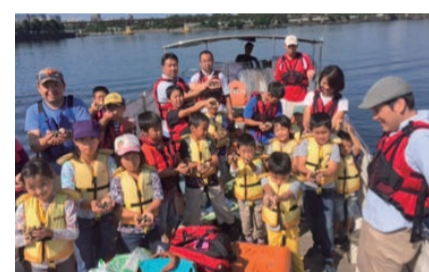
水辺プロジェクト

江戸時代以前より、品川湊(港町)として栄えた品川宿には、その歴史や文化が多く存在しています。「水辺の文化を伝えたい」「地元の子供たちに、水辺を身近に感じ、楽しんでもらえるような活動を行い、環境教育や防災教育につなげたい」を原点に、水辺プロジェクトを実施しています。目黒川流域、東品川海上公園、天王洲周辺、勝島運河周辺、近隣小学校のプールなどを主な活動エリアとして、清掃活動、Eポート体験、釣り・生き物調査、あさりまき、しながわ運河まつりなどを行い、品川区や周辺企業、近隣小中学校から多大なるサポートを受け、活動を推進しています。