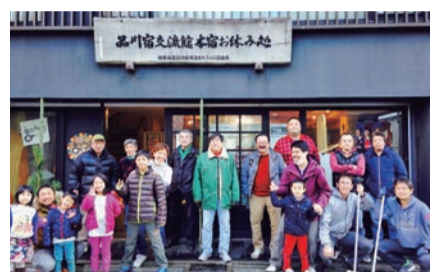
品川宿交流館運営

●運営委員会(月一)開催/賀詞交流会(年一)/総会(年一)/経過報告所作成/会員管理/会計業務